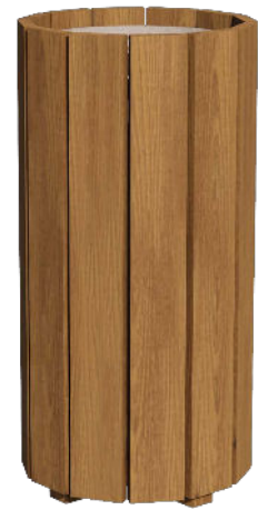
Réf. 627 967