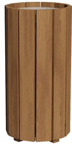
Réf. 627 967