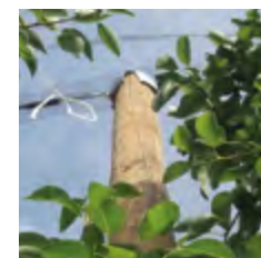
PIQUETS & POTEAUX

Depuis 1877, le bois est au coeur de notre métier.