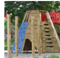
JEUX & SPORT