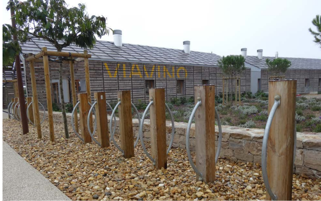
Bornes à vélos sciage bois-métal