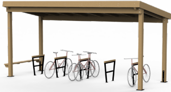
ABRIS O'VÉLO 5,50M