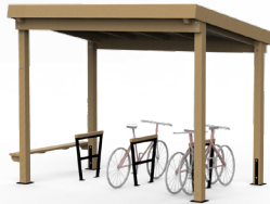
ABRIS O'VÉLO 3,30M