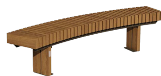
627151 - Banc LISA circulaire 60° Longueur : 2m