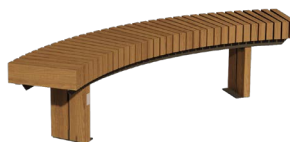
627142 - Banc LISA circulaire 30° Longueur : 2m