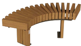
627140 - Banc LISA circulaire 90° Longueur : 1,25m

Autres références de bancs pour compositions :