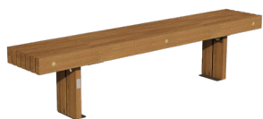
627141 - Banc LISA lames horizontales Longueur : 2m