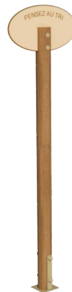
OPTION Mât «Pensez au tri» en gravure