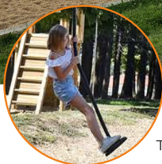
Tyrolienne avec siège pendule