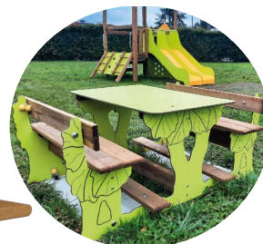
Table-bancs avec dossiers Réf. 600 153-01